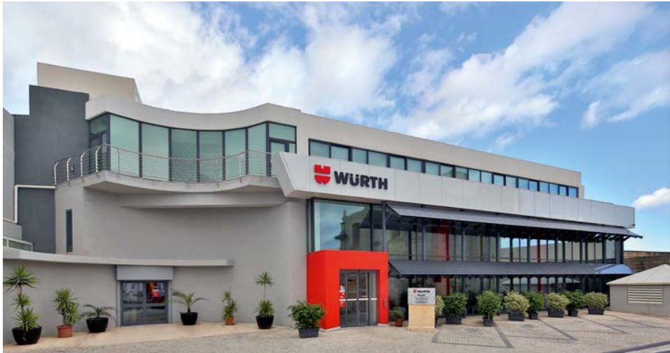
Würth Limited in Zebbug, Malta

Uns ist bewusst, dass von den genannten Beschränkungen nicht nur physisch vorhandene Waren betroffen sind, sondern auch Informationen und Technologien. Diese dürfen ebenfalls nicht unerlaubt weitergegeben werden. Verstöße hiergegen können enormen Schaden für die Würth-Gruppe verursachen. Alle Beschäftigten sind daher dazu aufgerufen, umsichtig zu agieren und z. B. Informationen nicht unerlaubt per E-Mail oder Telefon weiterzugeben. Unsere Mitarbeiterinnen und Mitarbeiter können und sollen sich mit Fragen und Unsicherheiten jederzeit an ihre Führungskraft oder die zuständigen Stellen im Unternehmen wenden.