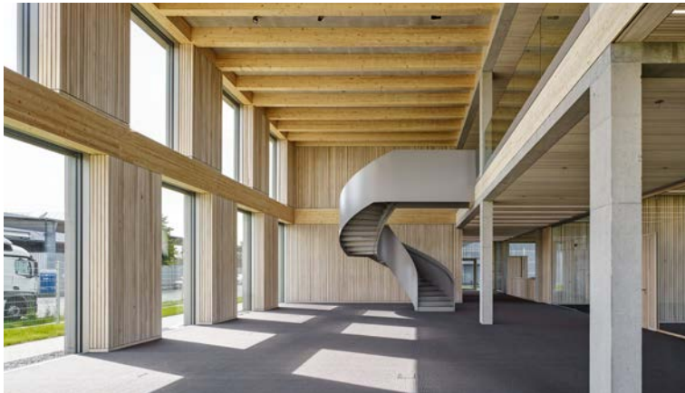
SWG Schraubenwerk Gaisbach GmbH in Waldenburg, Deutschland

Die Würth-Gruppe erkennt an, dass gewisse natürliche Ressourcen begrenzt sind. Wir streben deshalb den ökologisch sinnvollen Umgang mit diesen Ressourcen an. Dies bedeutet nicht nur, dass wir bestehende Gesetze zum Umweltschutz und zur Nachhaltigkeit einhalten, sondern auch den unnötigen Einsatz nicht erneuerbarer Ressourcen zu vermeiden suchen, wo immer dies möglich erscheint. Jeder Mitarbeiter ist dazu aufgefordert, sinnvolle Maßnahmen zur Reduktion von Ressourcenverschwendung und Umweltverschmutzung umzusetzen.