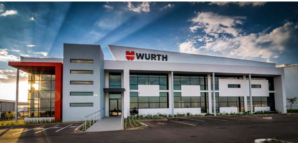
Wuerth South Africa (Pty.) Ltd. in Gauteng, Südafrika

Insbesondere bei der Erhebung und der Verarbeitung personenbezogener Daten lassen wir Vorsicht walten. Wir halten uns an die geltenden Datenschutzgesetze und benennen zuständige Stellen, die für deren Einhaltung verantwortlich sind.