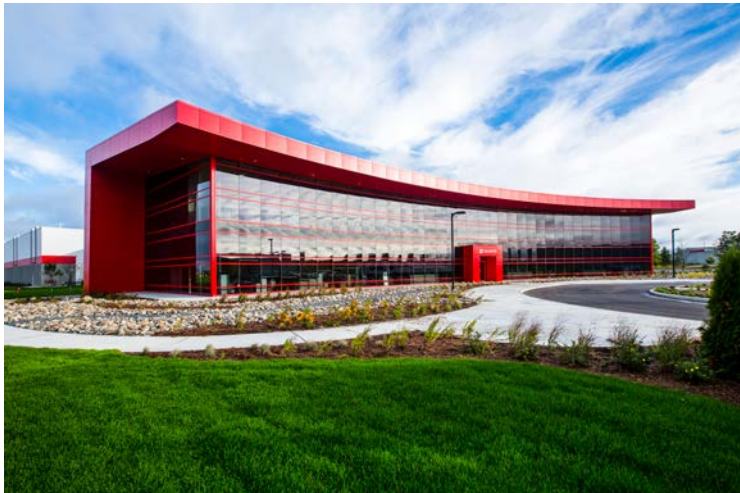
Würth Canada Ltd., Ltée in Guelph, Kanada

Ausgenommen sind gelegentliche schriftstellerische Tätigkeiten, Vorträge und vergleichbare Tätigkeiten. Wir freuen uns über ehrenamtliches Engagement der Mitarbeiterinnen und Mitarbeiter.