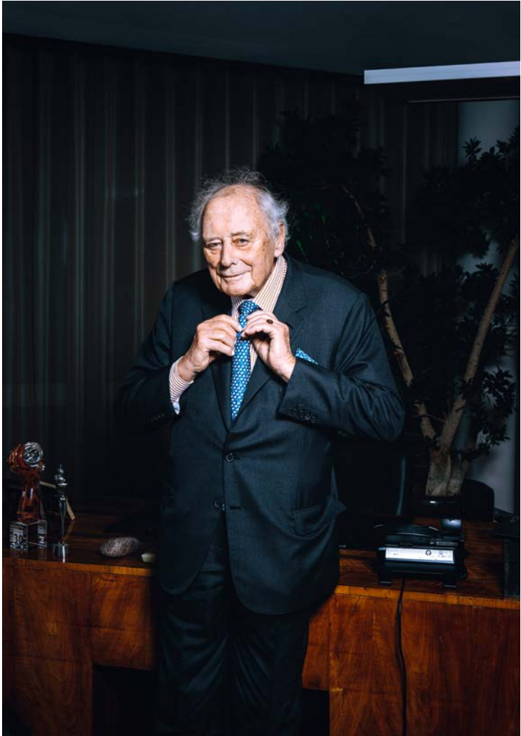
Prof. Dr. h. c. mult. Reinhold Würth, Vorsitzender des Stiftungsaufsichtsrats der Würth-Gruppe